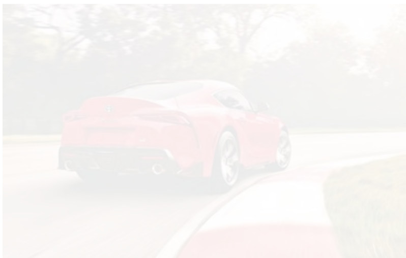
تصميم رياضي بامتياز

كان المصنعون الآخرون يعرضون نماذج أولية جديدة يعتمرون تقديمها في ما بعد، فقد كنت حينها أقود الطراز القديم من مركبة «سوبرا» والذي كان إنتاجها قد توقف آنذاك. لذا، وعلى الرغم من أن شركة تويوتا لم تكن تخطط لتطوير مركبة «سوبرا» جديدة، فإني مثل الكثيرين من المعجبين بها حول العالم، كنت أتوق بشغف حدوث ذلك. وفيها في مركبة تويوتا «جي آر سوبرا» التي ستعيد تعريفنا لاختياراتنا مطولة على حلبة نوريورغرينغ، ويمكنني الجزم بكل ثقة بأنها أفضل من أي وقت مضى».