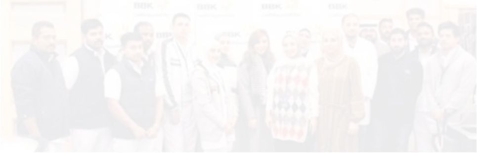
موظفو وموظفات البنك شاركوا في الحملة