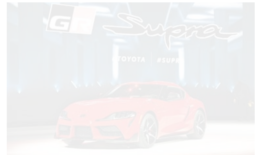
تويوتا سوبرا جاري

ويأتي الطراز الجديد كلياً من مركبة تويوتا «سوبرا» والذي يعد الجيل الخامس منها، بعد توقف طويل استمر قرابة 17 عاماً منذ إيقاف إنتاج الجيل السابق في عام 2002. ومنذ إنطلاقها لأول مرة في عام 1978، كانت جميع أجيال هذه المركبة مزودة بمحرك